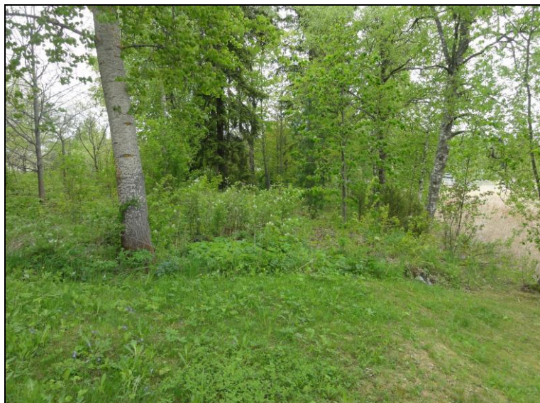
Pohjoisen tontin pohjoisinta osaa.