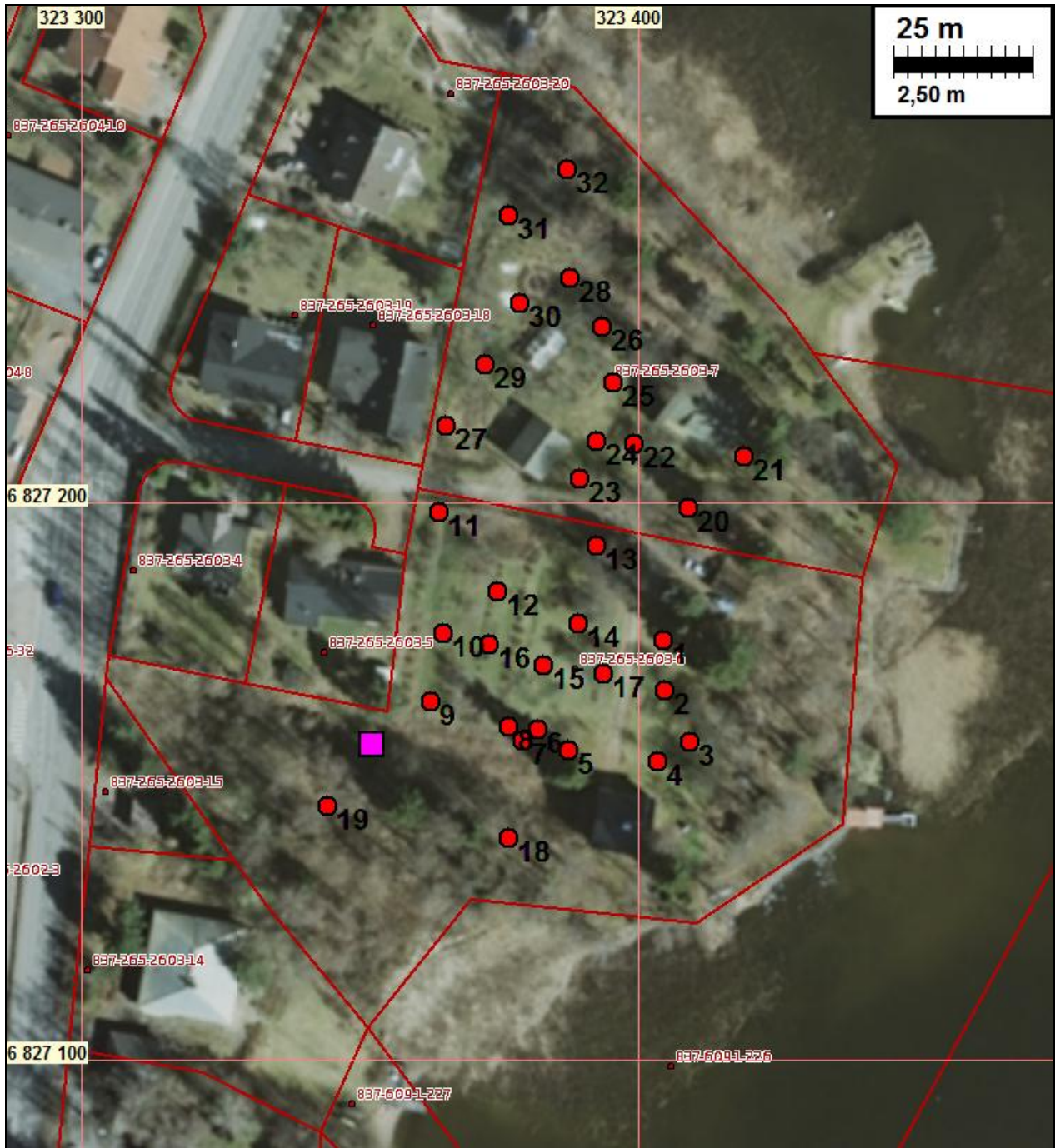
Koekuopat – punainen pallo.