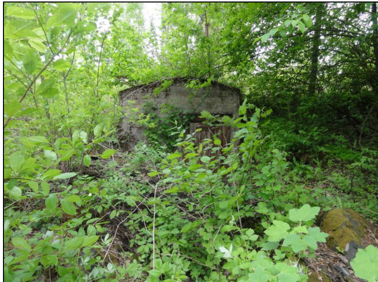
Vanha betoninen maakellari tontilla 6 (N 6827156 E 323352 Z 99.6) kuoppakartalla sinipun. neliö