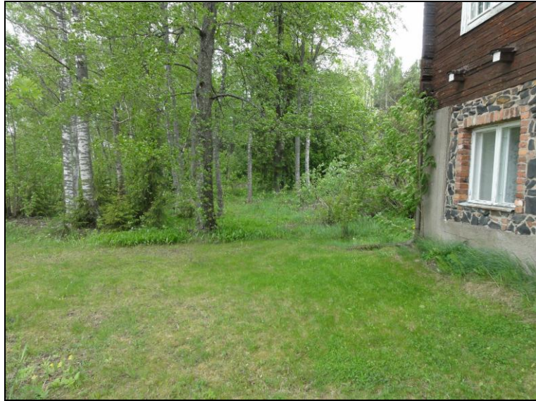
Eteläistä tonttia 6, itään