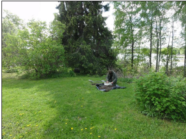
Timo Sepänmaa tutkii koekuoppaa tontin 6 etelälaidalla