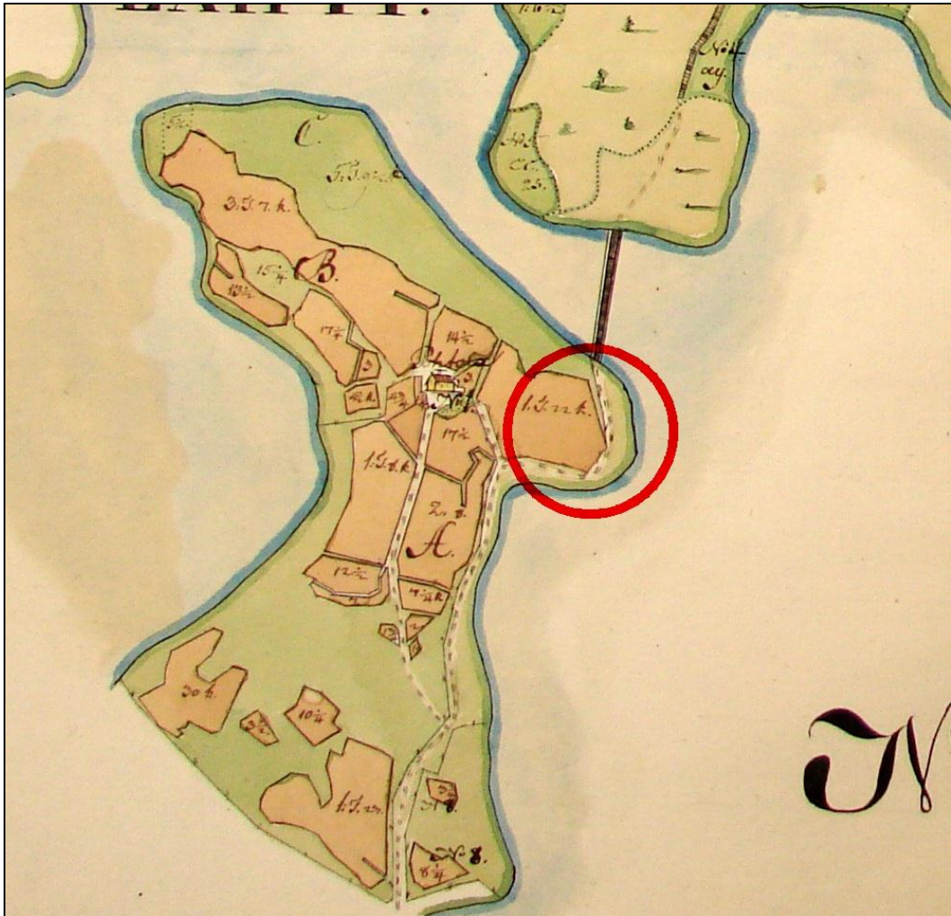
Kartta: Siivikkala-Pohtola 1763 (H6 13/2), Ote Pohtolaa kuvaavasta osasta. Tutkimusalueen sijainti merkitty päälle punaisella ympyrällä.