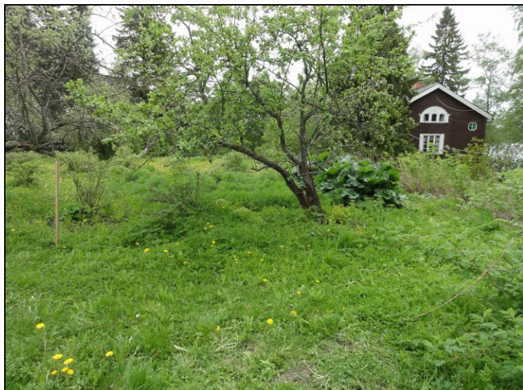
Eteläisen tontin 6 maastoa sen länsilaidalta itä-kaakkoon.