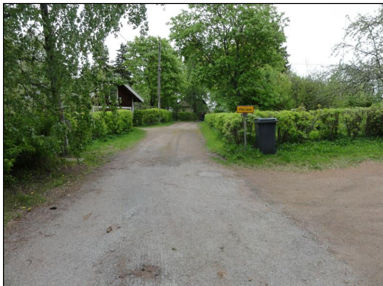
Pohtosillankujaa itään tutkimusalueen länsirajan länsipuolelta