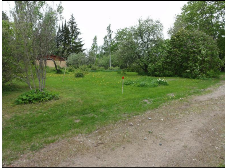
Eteläistä tonttia 6 luoteeseen