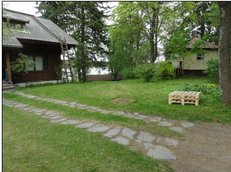
Pohjoista tonttia 7 itä-koilliseen.